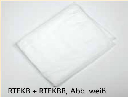
RTEKB + RTEKBB, Abb. weiß