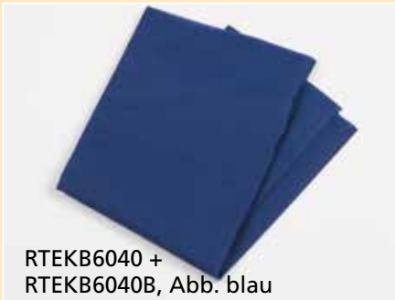
RTEKB6040 + RTEKB6040B, Abb. blau